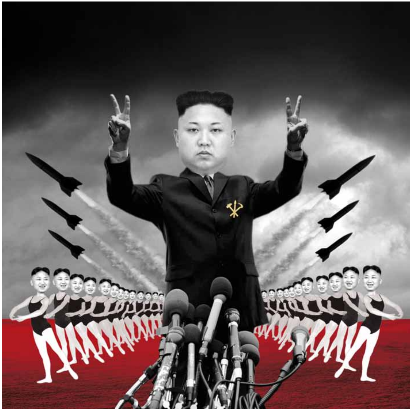
01 KIM JONG-UN: SUPREME LEADER OF THE DEMOCRATIC PEOPLE'S REPUBLIC OF KOREA, FIRST SECRETARY OF THE WORKERS' PARTY OF KOREA, FIRST CHAIRMAN OF THE NATIONAL DEFENCE COMMISSION OF THE DPRK AND SUPREME COMMANDER OF THE KOREAN PEOPLE'S ARMY 90X90 CM · [2015]