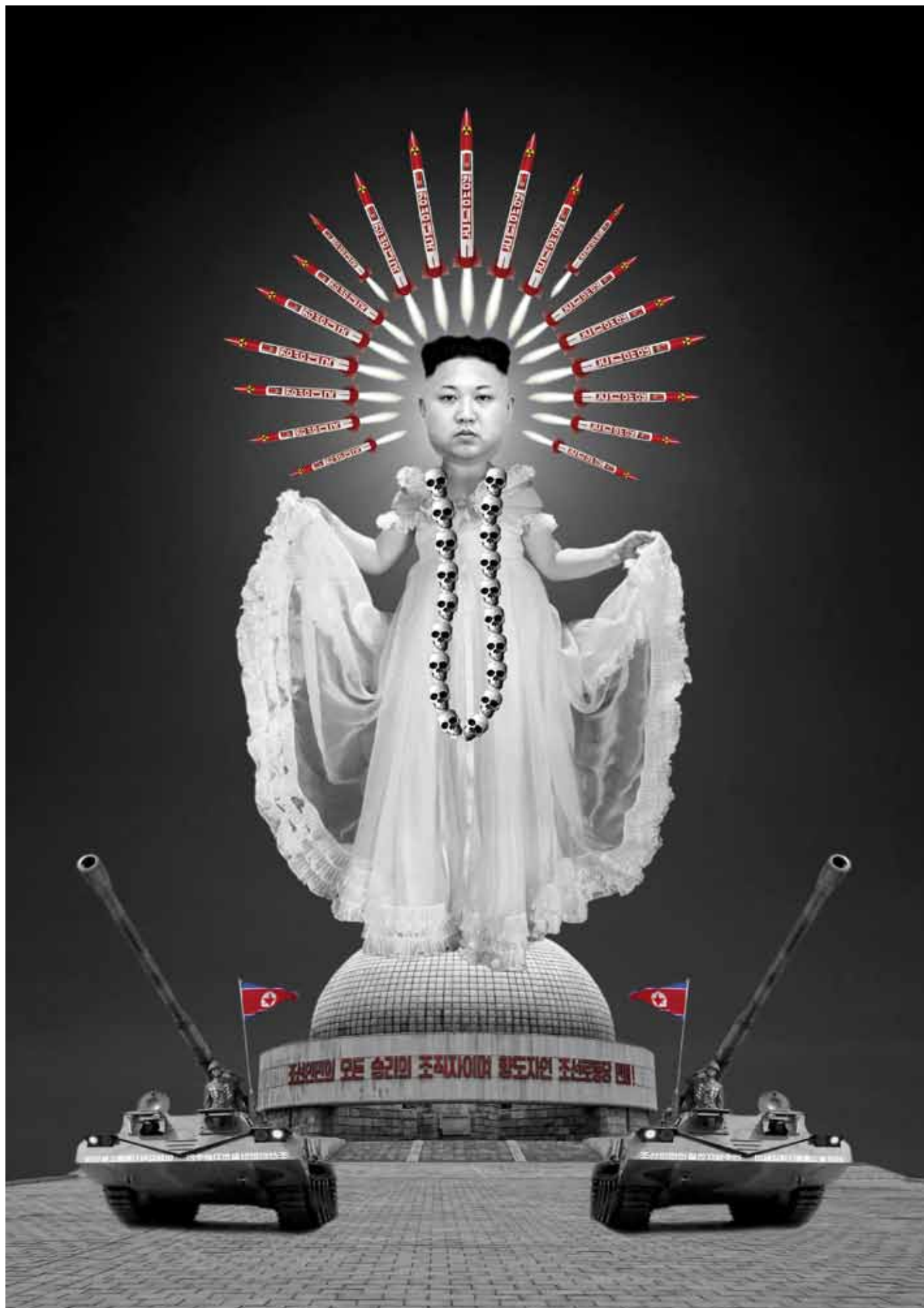
05 | YOU SHALL HAVE NO OTHER LEADERS BEFORE ME · 100x70 CM · [2015]